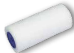
MOLTOPRENOVÁ HOUBA - HRUBÁ