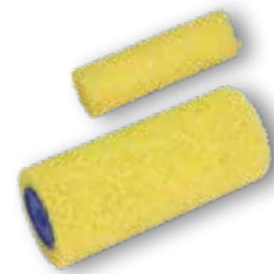
MOLTOPRENOVÁ HOUBA - HRÁŠEK