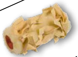
ZLATÝ VLAS - ROHOVÝ