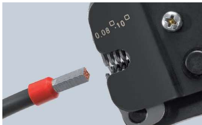
Čtyřhranný krimpovaný spoj

lisování od 0,08 - 10,0 mm 2 a 16,0 mm 2 v jednom profilu s pákou pro volbu nastavení rozsahu lisování 0,08 - 10 nebo 16,0 mm 2 ; velmi vhodné pro všechny koncové dutinky Twin do 2 x 6 mm 2 nebo 2 x AWG 8