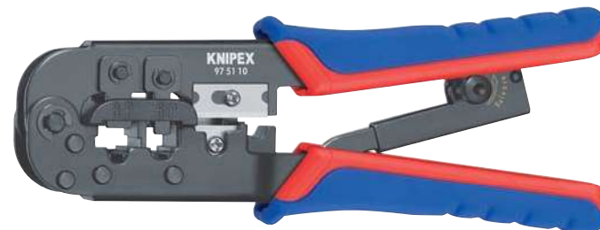
97 51 10