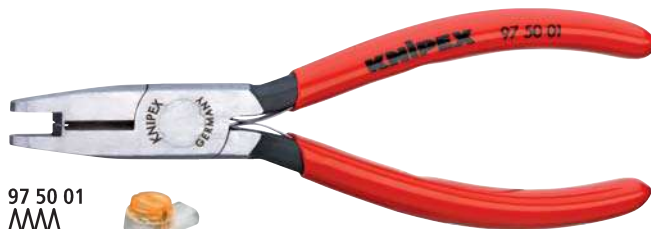
97 50 01