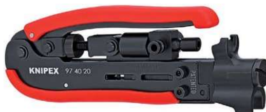
97 40 20 SB