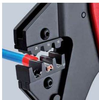
97 43 200 s lisovacím nástavcem 97 49 09 pro koncové dutinky kabelů