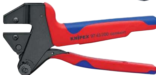
97 43 200 A MM (PATENTED)

97 43 05 s namontovaným krimpovacím nástavcem pro neizolované, otevřené konektory (šířka konektoru 4,8 a 6,3 mm)