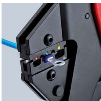
97 43 200 s lisovacím nástavcem 97 49 06 pro izolovaná kabelová oka, konektory a dvojité spojky