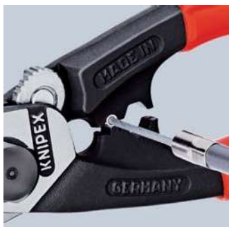
Nalisování koncové dutinky na tažné lano

Kleště se závěsným okem pro připevnění pojistného lanka