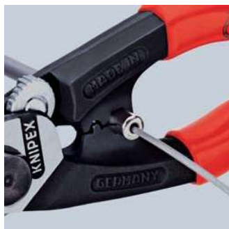
Nalisování koncovky na kryt bovdenu