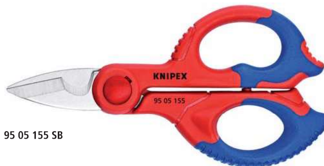
95 05 155 SB