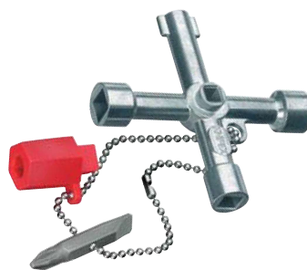
00 11 03

dlouhé provedení, celková délka ramen: 76 mm; doplňkový čtyřhran 5 mm