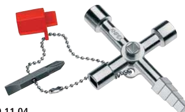
00 11 04