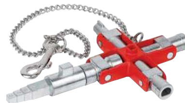
00 11 06 V01