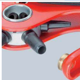
Jednotlivé střížníky je možné vyměňovat