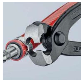
Utěsnění hadice na kapaliny na hrdle pomocí bočních čelistí