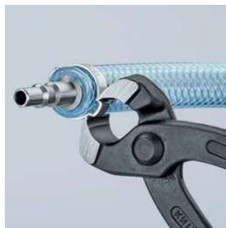
Utěsnění pneumatické hadice na rychlospojce