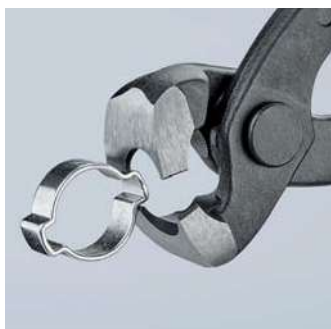
Použití čelních čelistí