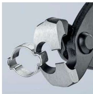
Použití bočních čelistí