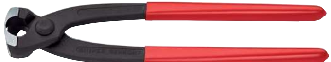
10 99 I220