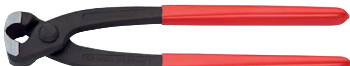
10 98 I220

Obzvlášť univerzálně použitelné díky dodatečným bočním čelistem