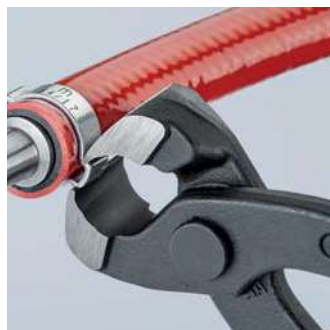
Utěsnění hadice na kapaliny na hrdle