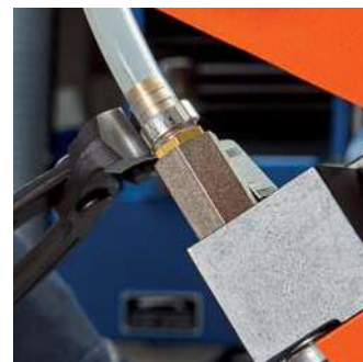
Utěsnění připojení hadice na centrálním mazání