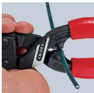
71 31 200/71 32 200/71 32 200 T s úchopovou plochou pod kloubem pro uchopení a tahání drátů od Ø 1,0 mm