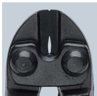
71 31 200/71 32 200/71 32 200 T vybrání v břitu usnadňuje stříhání silnějších drátů např. u zavěšených stropních konstrukcí