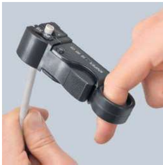
Třístupňový řez v jedné pracovní operaci