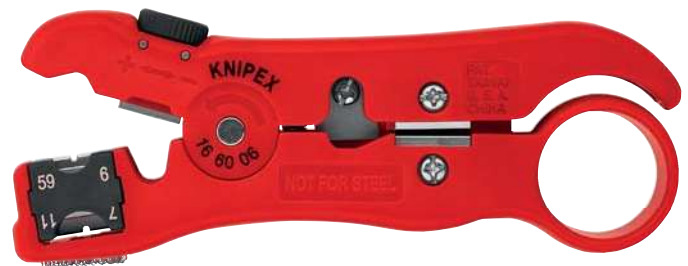
16 60 06 SB MM