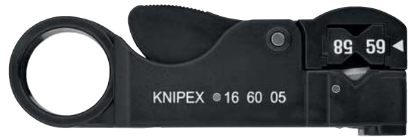
16 60 05 SB MM