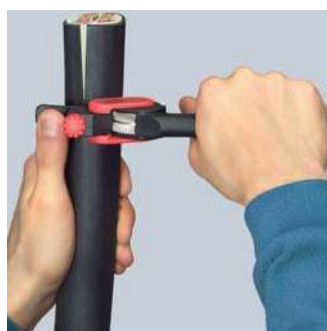
Otáčení nástroje pro obvodový řez