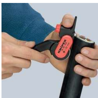
Nasazení nářadí pro odstřížení v podélném směru