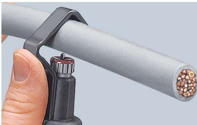
Nastavení nástroje pro obvodový řez