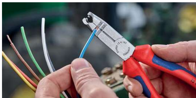
Otvory pro odizolování pro vodiče 1,5 mm 2 a 2,5 mm 2