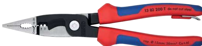
13 82 200 T