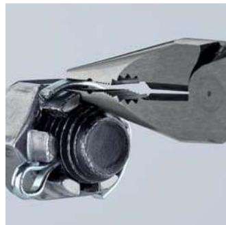
Hrot zůstane i při větších utahovacích silách tvarově stálý