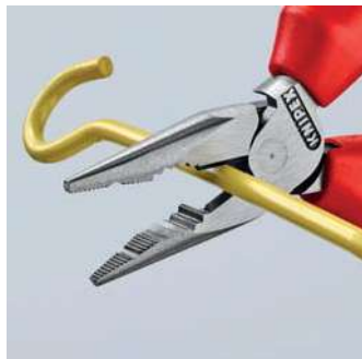
Jednoduché stříhání díky vysoce přesazenému silovému kloubu