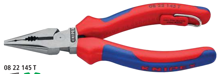
08 22 145 T