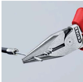
Vyfrézovaná drážka v oblasti uchopení

Kleště se závěsným okem pro upevnění pojistného lanka