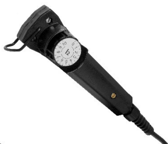
tradičný diaľkový ovládač MMA 3 na nastavovanie intenzity prúdu