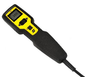
multifunkčný diaľkový ovládač ER 1 so zabudovaným displejom