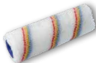
FASÁDNÍ VÁLEČEK SPARTA