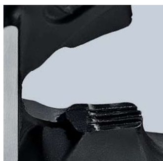
S úchopovou plochou pod kloubem pro uchopení a tahání drátů od Ø 1,0 mm