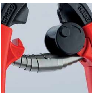
Otevírací pružina a přepravní pojistka jsou součástí rukojetí; pro pohodlnější práci a bezpečnou přepravu