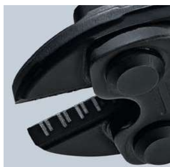
Jednoduché štípání velkých průřezů díky břitů s mikrostrukturou