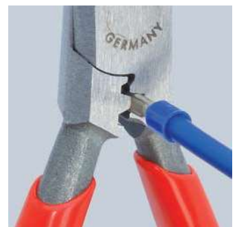
Krimpování 0,5 až 2,5 mm 2