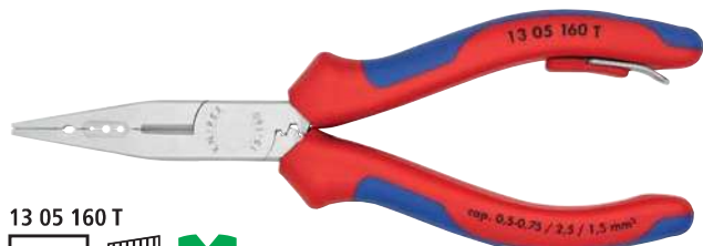
13 05 160 T