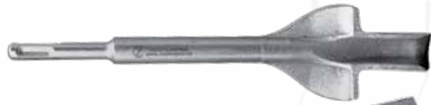
Sekáč SDS-plus křídlový Chisel SDS-plus wing Flügelmeißel SDS-plus